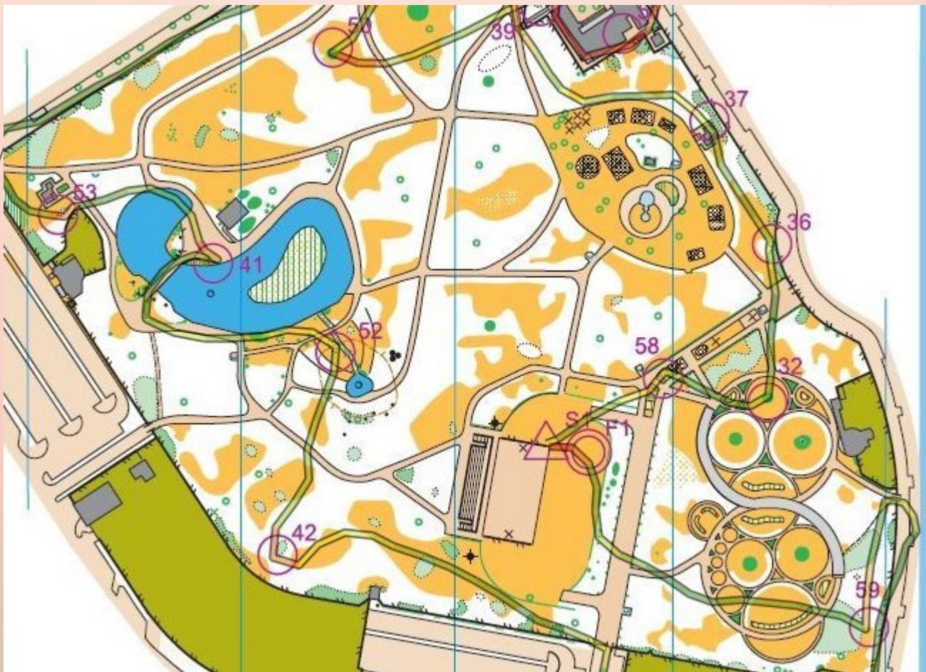
Ejemplo de plano de orientación