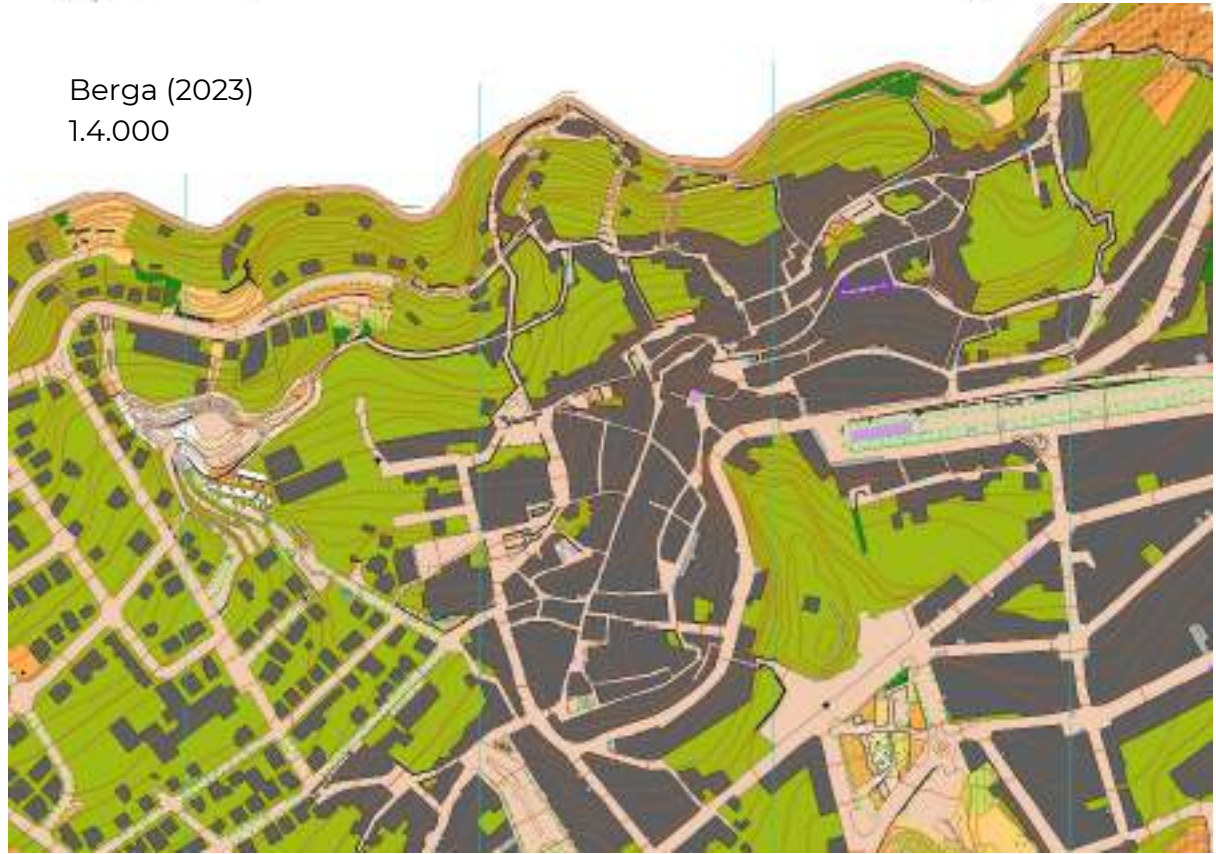
Berga (2023) 1.4.000