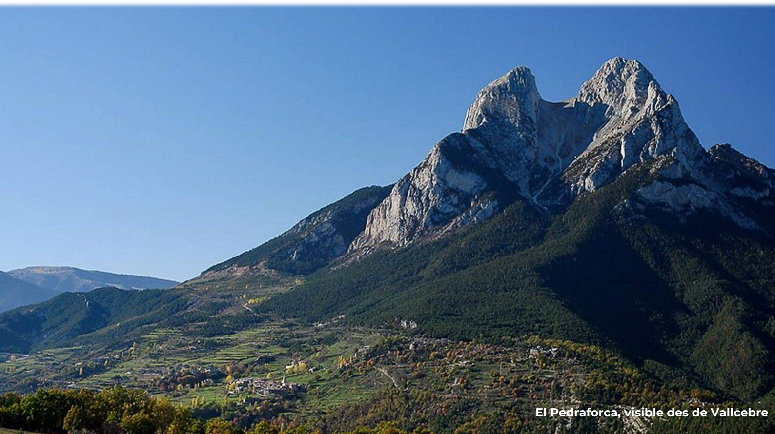
El Pedraforca, visible des de Vallcebre

Berga , con una extensión de 22,57 km 2 , es la capital del Berguedà y está situada en el centro de la comarca. Representa su punto de confluencia económica, social y de comunicaciones. Se encuentra a escasamente 30 minutos de Manresa o a 70 de Barcelona. En dirección norte, el Túnel del Cadí abre las comunicaciones con la Seu d'Urgell (45 minutos) y con Puigcerdà (30 minutos).