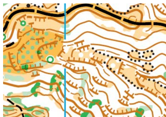
Ventanas mapa bosque Torrellas