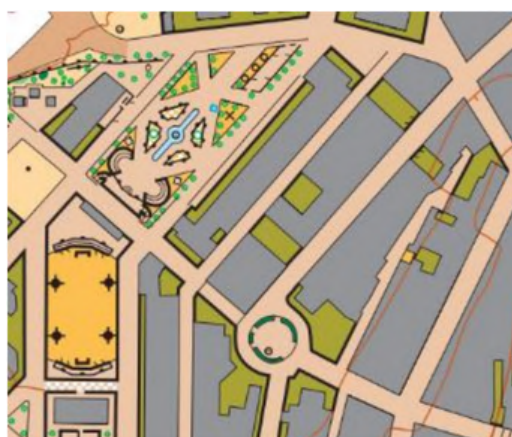
Santa Elena (Sprint)