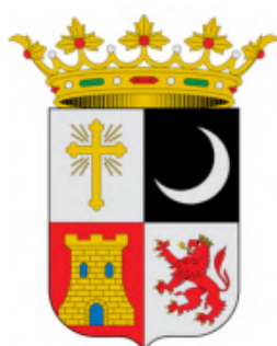
Ayto. Santa Elena