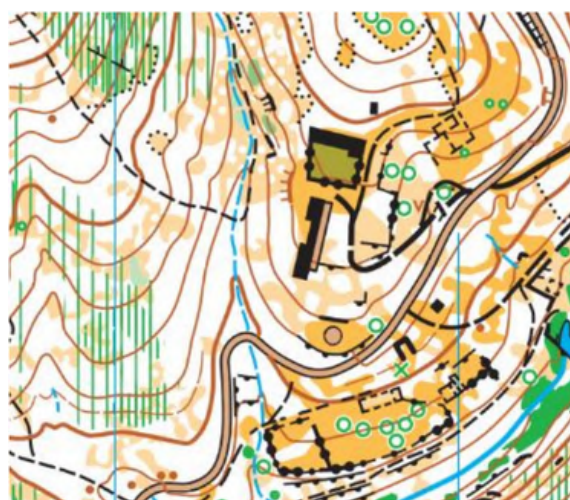
La Aliseda (Media distancia y Trail-O)

Prueba tipo sprint, respuestas A-Z. Todos los deportistas podrán realizar la prueba después de la larga distancia. Es prueba sprint por lo que se dispone de un tiempo máximo, con penalización si se sobrepasa. En los puntos donde se pueda generar dudas existirán puntos de observación para facilitar e identificar el desafío.